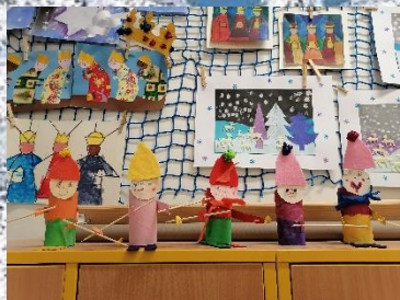
Učili jsme se i o sportech a o tom, jak

funguje lidské tělo, z jakých částí se skládá, co je dobré jíst, abychom byli zdraví ... a jaké výrobky a výtvary jsme při vyučování tvořili? 😊