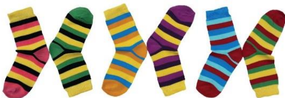
(Actual photo of our LOTS OF SOCKS logo socks)